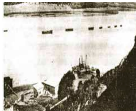
La construction du port de Mehdia en 1918.