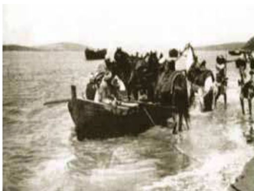
Mehdia en 1908 : Débarquement de chevaux à l'Oued Sebou qui était navigable sur 100 km.

Aujourd'hui, les 2 ports de Mehdia, à savoir le port de pêche et l'avant port (ex-port minéralier) sont utilisés pour la pêche et l'industrie de la pêche.