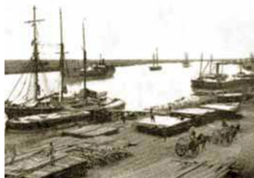
Les quais du port de Kénitra en 1916

En 1933, un silo à grains d'une capacité de 120.000 quintaux a été construit pour l'export des produits de la région de Rabat, du Gharb et de Ouazzane avec une cadence de chargement de 400 T/H.