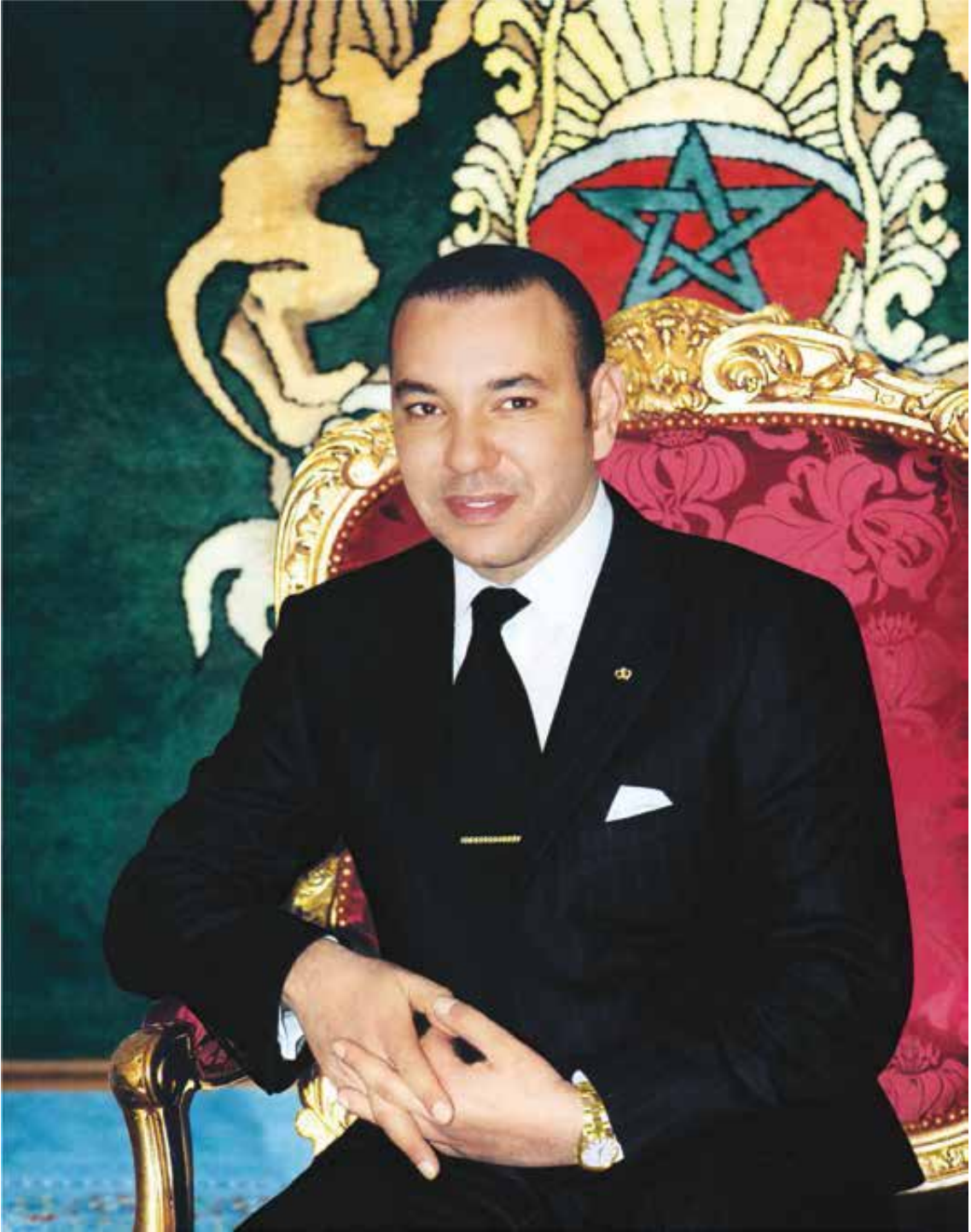
صاحب الجلالة الملك محمد السادس نصره الله