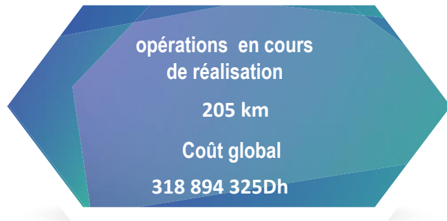
les opérations réalisées entre 2012 et 2015