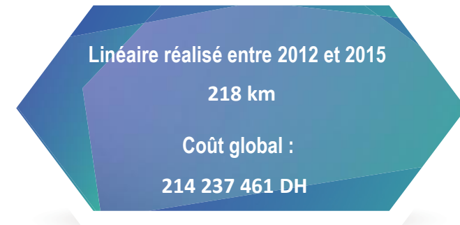
Les opération en cours de réalisation